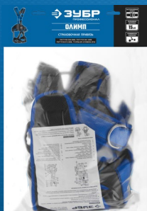
Упаковка: пакет с хедером

Применяется как элемент страховочной системы для охвата тела с целью предотвращения падения